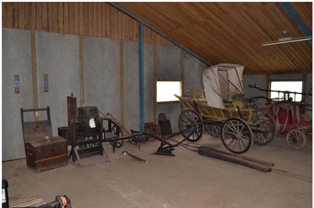
Et af Ærø Museums magasiner – den såkaldte Borgnæslade – før og efter en samlingsgennemgang i 2013. Det viser, hvordan en samlingsgennemgang, hvor der er ryddet op og gjort bedre plads til genstandene, kan være med til at forbedre magasinforholdene.