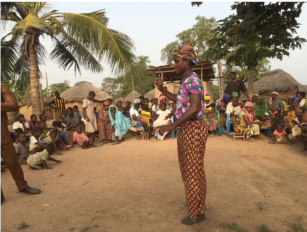
Rigsrevisionens besøg hos en gruppe landmænd, som under privatsektorprogrammet fik støtte til at drive et mere produktivt landbrug.