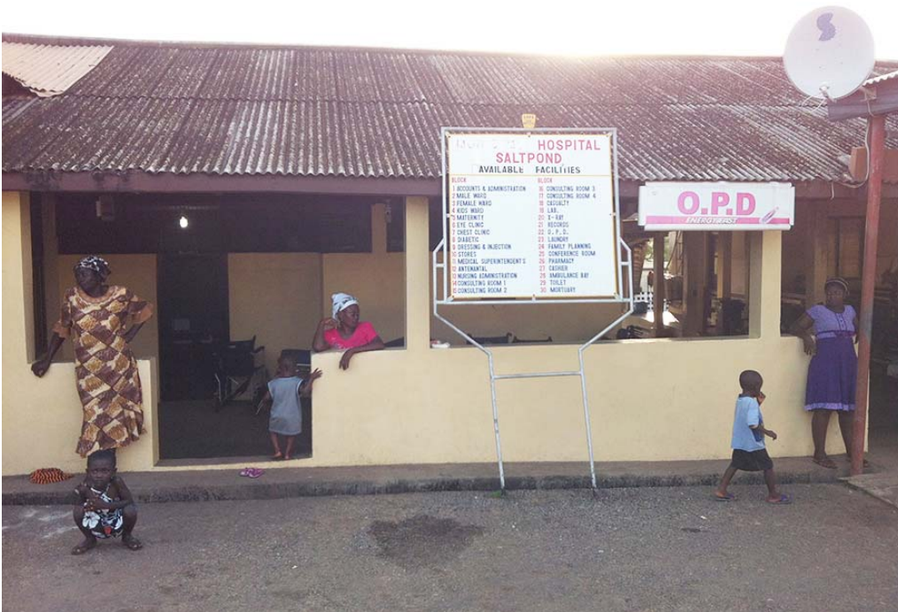
Rigsrevisionens besøg på et hospital ved revisionen af sundhedsprogrammet.