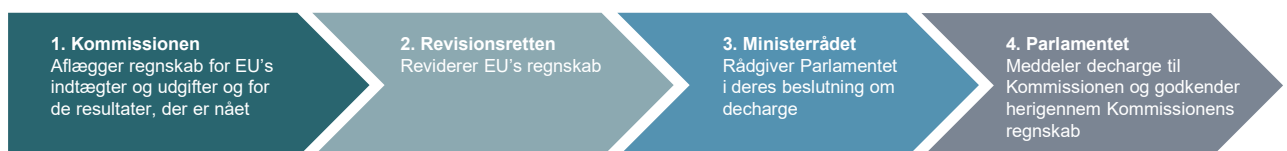
Figur 1. De 4 trin i udarbejdelsen, revisionen og godkendelsen af EU's regnskab

2. Udarbejdelsen, revisionen og godkendelsen af EU's regnskab er en proces med 4 trin, jf. figur 1.