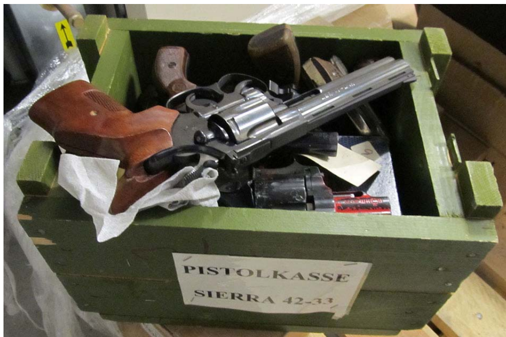
Kasse med løse våben i en politikreds.