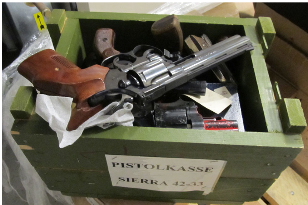
Kasse med løse våben i en politikreds.