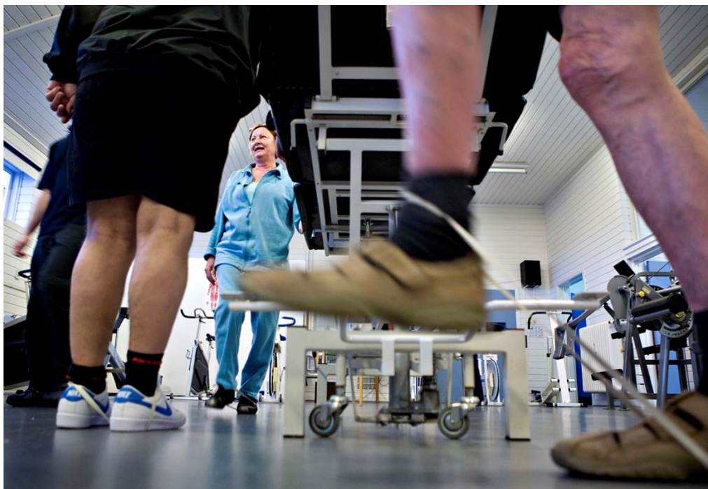
Genoptræning i en kommune.